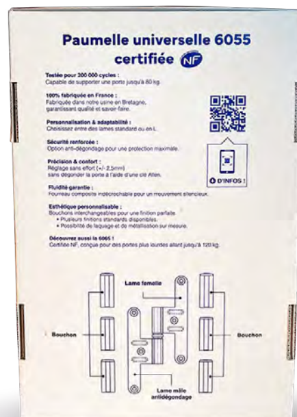
Atouts produits et plans au verso

POUR RECEVOIR GRATUITEMENT NOTRE COFFRET DE DÉMONSTRATION :