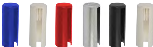
6 bouchons cache-paumelle